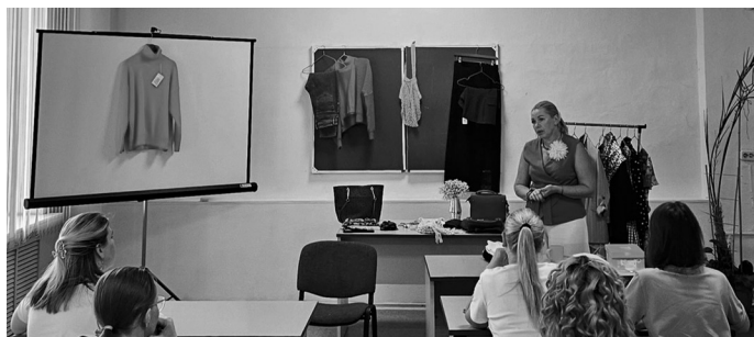
АНБО «КругОворот» реализует проект «Мама в ресурсе» при поддержке Правительства Вологодской области.

Благотворительная организация «КругОворот» приступила к реализации нового проекта «Мама в ресурсе» в Вологде.