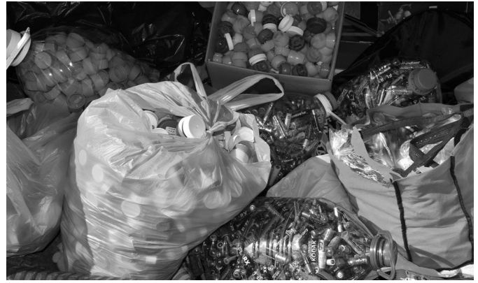
Общественно полезный проект «Раздельно и точка» реализуется ВРОКЭО «Ноосфера» при поддержке Правительства Вологодской области.

Обращаем внимание волонтеров, что вещи должны быть чистыми и в хорошем состоянии. Кроме того, необходимо знать, что экотакси необходимо встречать на улице вместе с вещами и погружать их самостоятельно в автомобиль.