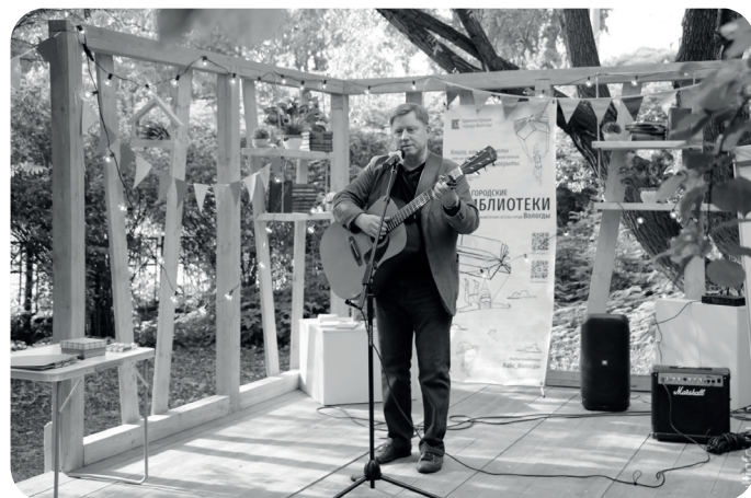
Литературный дворик "Литература тут"

На базе школы №5 г. Череповца будет реализован проект "Россия – это мы!" по созданию пространства для молодежи Зареченского района города для внеурочной деятельности. В новом пространстве будут проводиться семинары и уроки с известными деятелями культуры, историками, лидерами общественных организаций, государственными и муниципальными служащими. До конца 2023 года Центром поддержки молодежного парламентаризма будет создан исторический клуб, где ребята начнут более углубленно изучать темы по истории России.