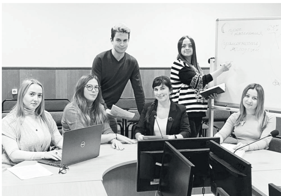
Фото команды.