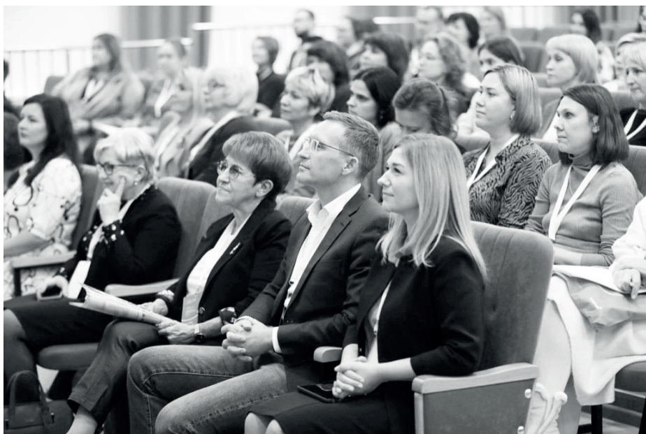
Фото с конференции.

"Наша прямая обязанность - помогать людям. Любой человек, оказавшийся в трудной жизненной си-